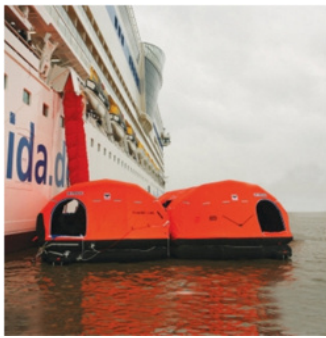
ライフラフト展開後の写真

ライフラフト2基を海上へ降ろし、その上にシューターを降ろし船員による避難訓練を実施します。