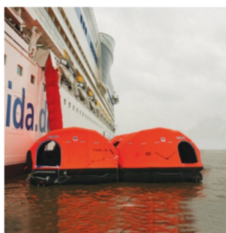
ライフラフト展開後の写真

ライフラフト2基を海上へ降ろし、その上にシューターを降ろし船員による避難訓練を実施します。